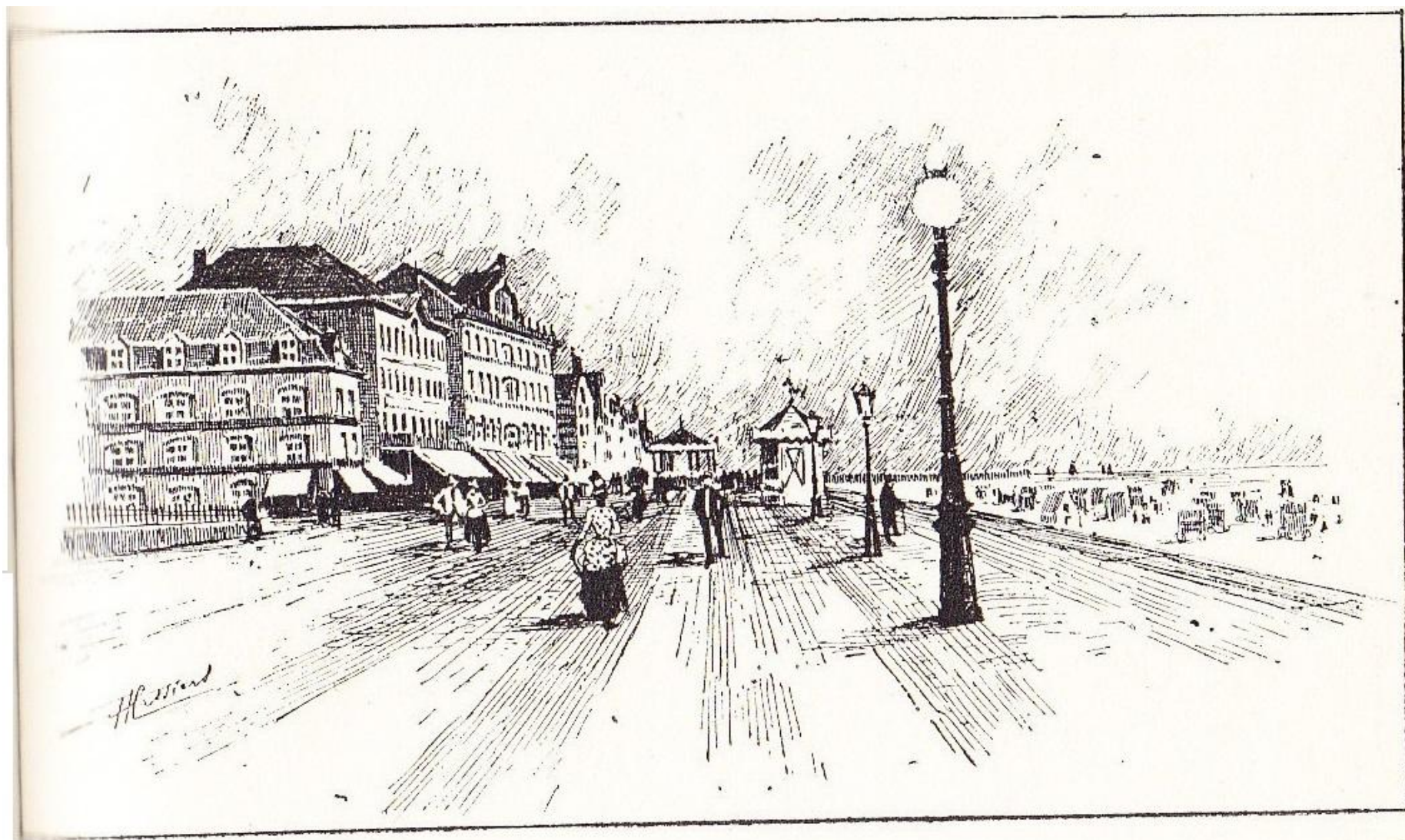
Digue de Blankenberghe.